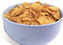
Un bol de céréales à grains entiers avec du lait écrémé