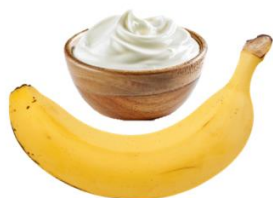
Une banane avec du yaourt grec