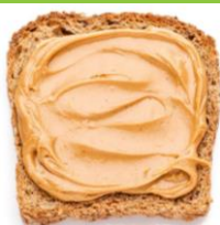
Rôties de grains entiers garnies de beurre de noix et de miel