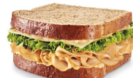
Un sandwich à la dinde avec une mandarine