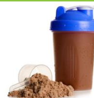
Une boisson protéinée ou un smoothie