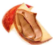
Tranches de pommes garnies de beurre d'arachide